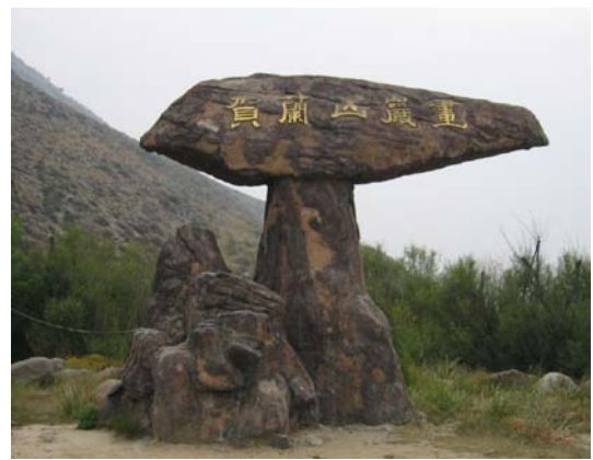
图 6 贺兰山岩画