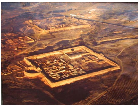
图 5 西夏王陵