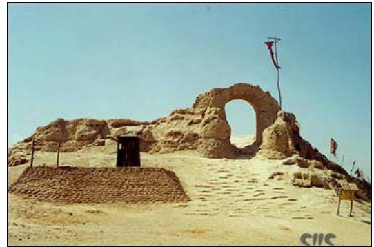
图 4 镇北堡影视城