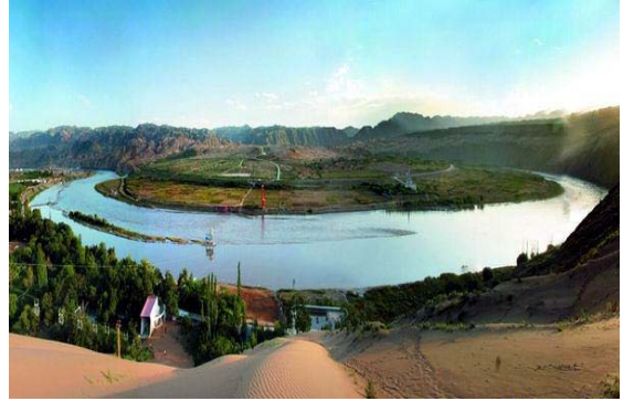
图 2 宁夏沙坡头