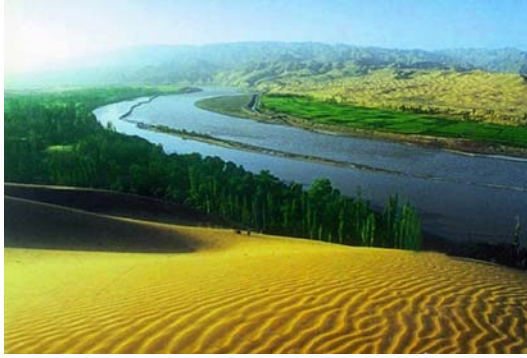
图 1 宁夏沙湖

费用构成：528 元/人（上述所列景点首道大门票、沙湖含大船、西夏王陵含环保车、两个中餐、优秀导游服务、空调旅游车、旅行社责任险）